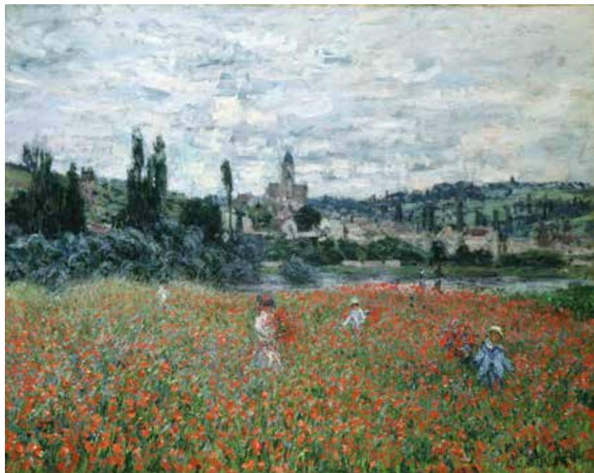
Champ de coquelicots près de Vétheuil, vers 1879 Claude Monet

Si... c'est la passion que tu m'inspires, Raie!