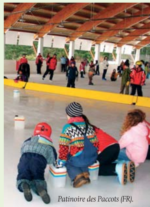
Patinoire des Paccots (FR).