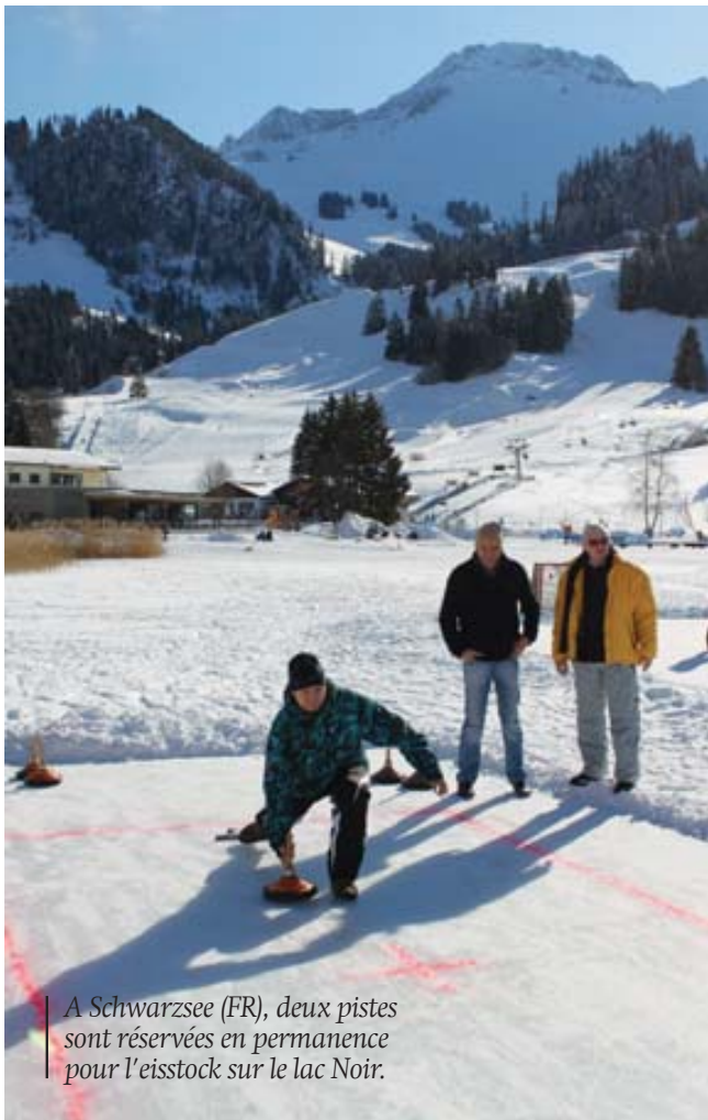
A Schwarzsee (FR), deux pistes sont réservées en permanence pour l'eisstock sur le lac Noir.